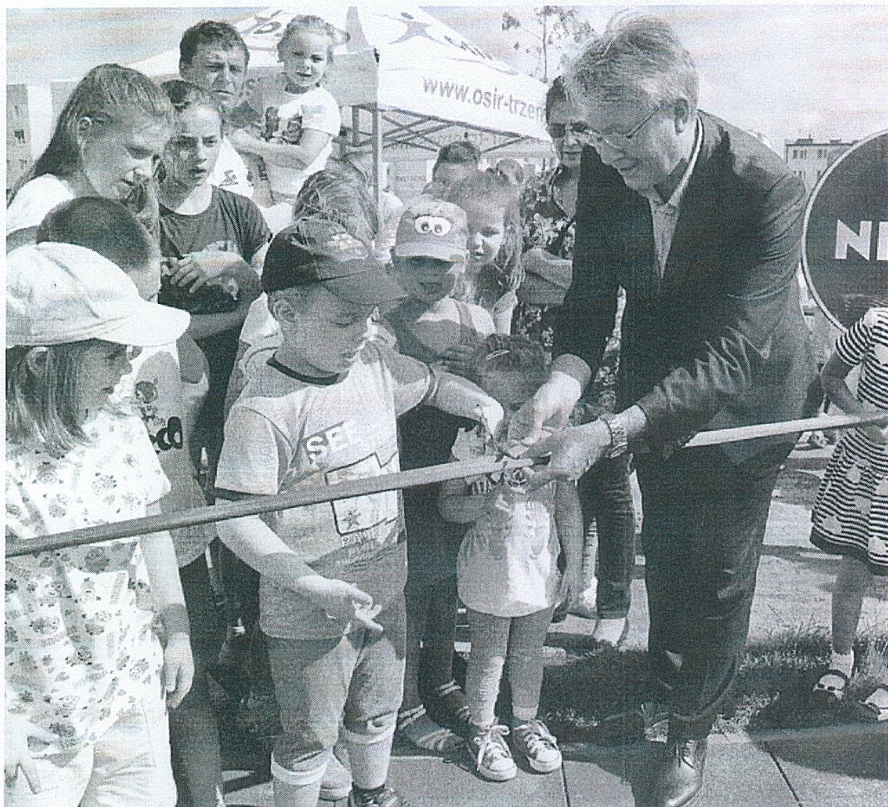
— Srem--_Zdjecia z otwarcia_NIVEA_P_2016 (8).jpg —